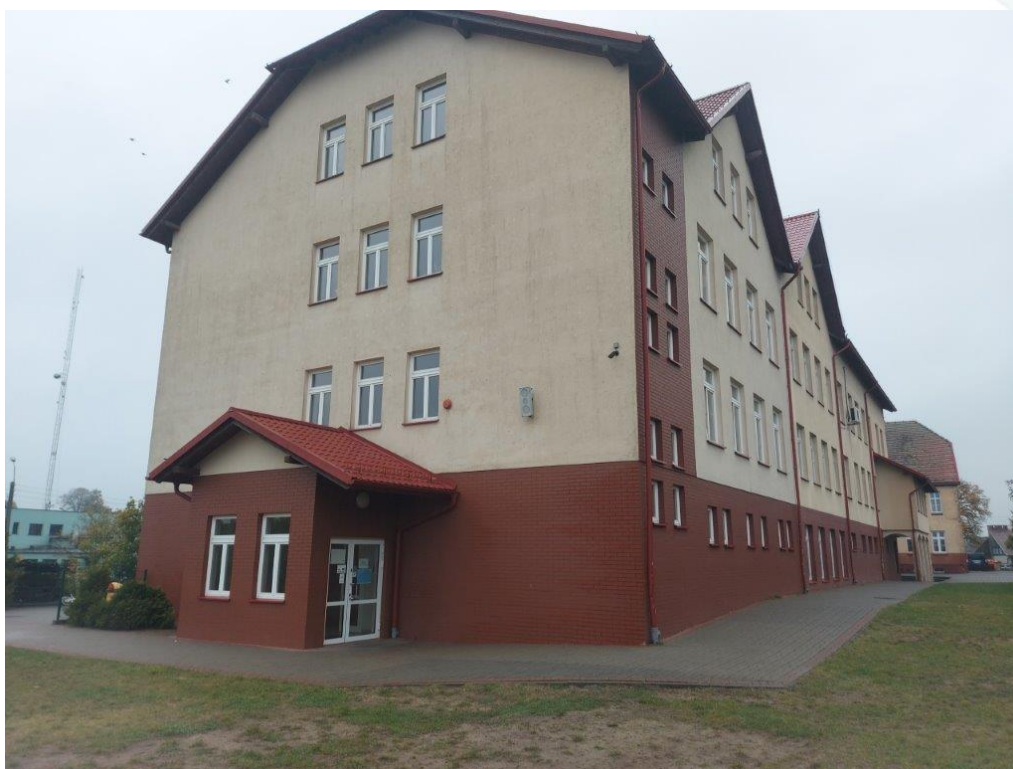
Fot. Obszar opracowania – widok ogólny.