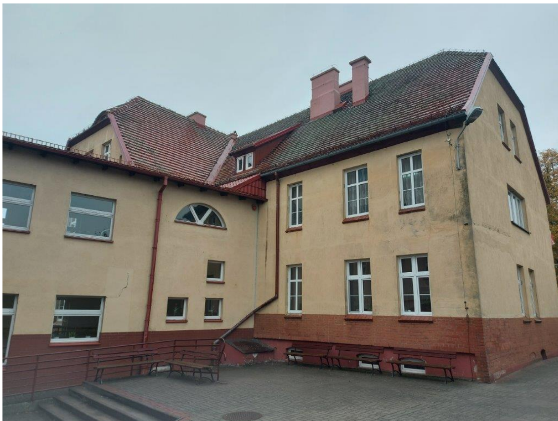
Fot. Obszar opracowania – widok ogólny.