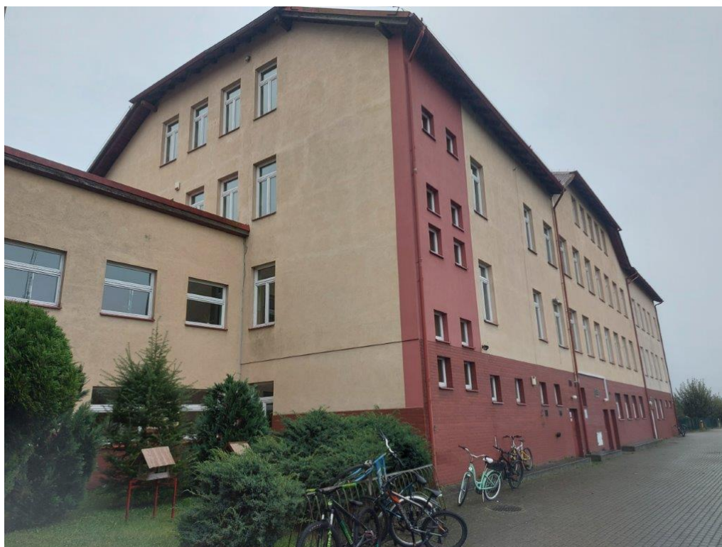
Fot. Obszar opracowania – widok ogólny.