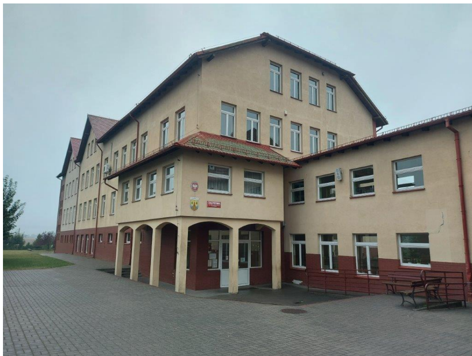
Fot. Obszar opracowania – widok ogólny.