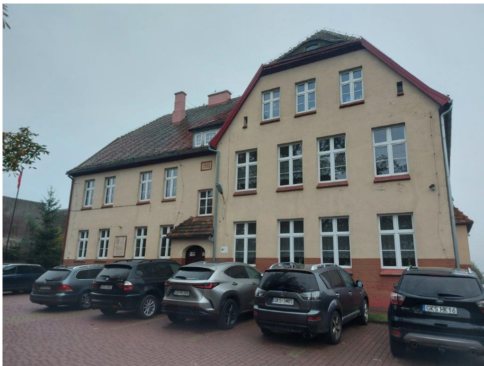
Fot. Obszar opracowania – widok ogólny.