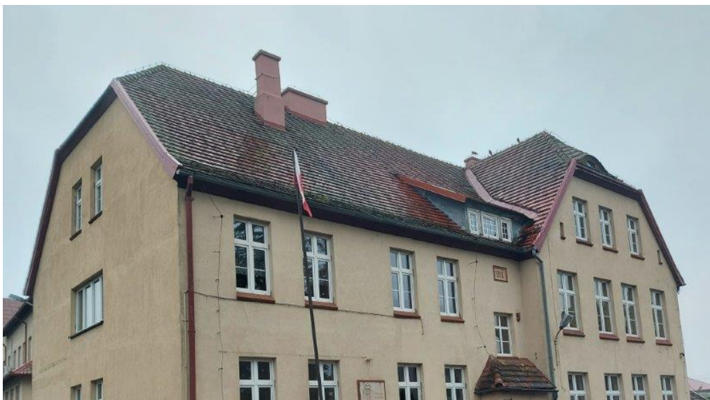
Fot. Obszar opracowania – widok ogólny.