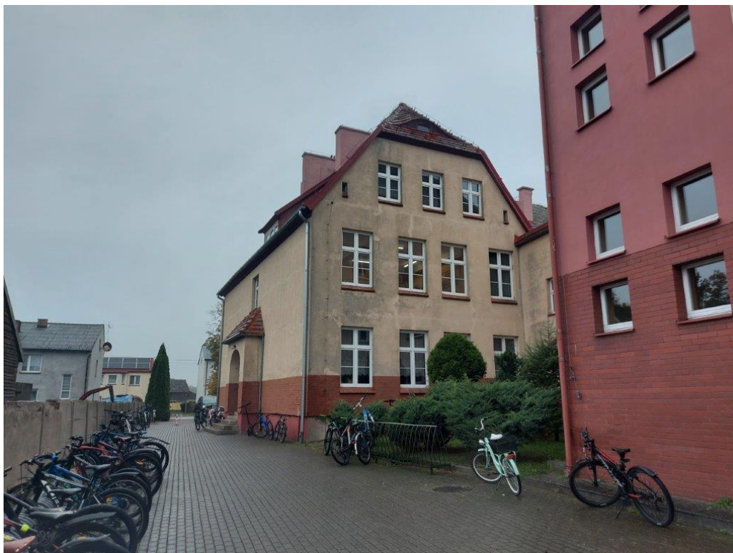
Fot. Obszar opracowania – widok ogólny.